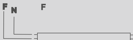
TIPO DE CONEXIÓN